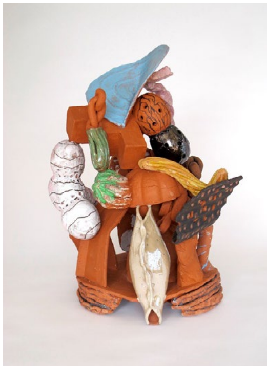
Charivari, 2023 Terre cuite émaillée 50 x 40 x 34 cm © P.Loughran

Le travail de Patrick Loughran se distingue par une approche composée et imaginative de la sculpture. Les pièces qu'il crée sont le fruit de plusieurs méthodes et procédés. Certaines sont construites à partir d'une multitude de formes, puisées dans diverses sources telles que des carnets de dessins ou des photographies d'objets et d'ornements architecturaux. D'autres émergent de son regard critique par l'amélioration continue de ses pièces antérieures. Il en est même qui naissent à partir d'images mystérieuses puisées dans ses rêves.