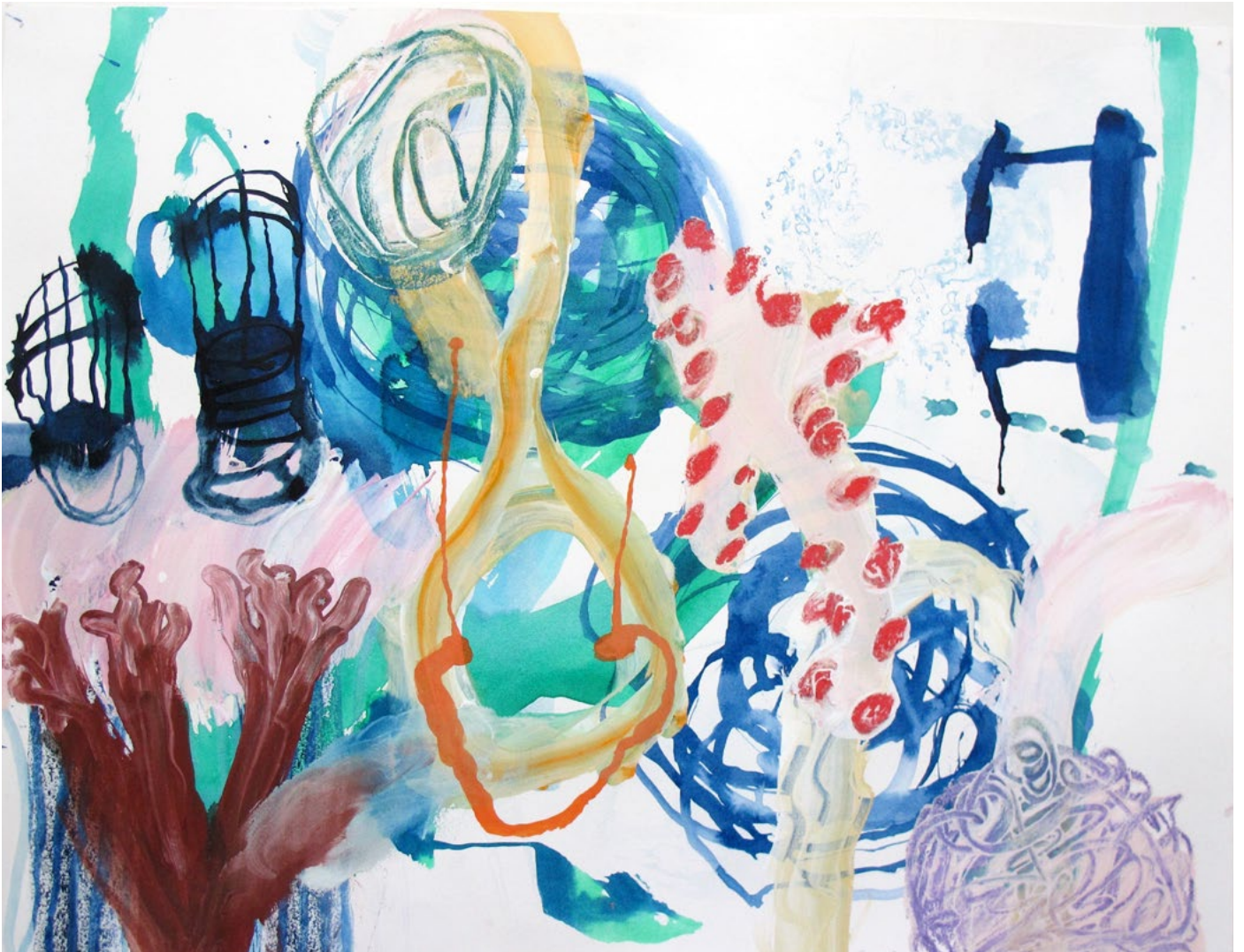
Lost and Found, 2017 Dessin, techniques mixtes 50 x 65 cm