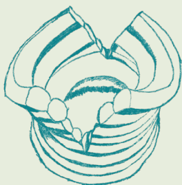
Dessins numériques sur tablette

Un rond ouvre une fenêtre, le volume se dessine, la terre devient plastique. À l'interstice de la sculpture et du fonctionnel, mes pièces oscillent entre objet du quotidien et forme rêvée. Les engobes colorés se glacent, la matière révèle ses aspérités et des formes simples apparaissent. On peut les prendre dans les mains, les déplacer, les allumer, les associer.