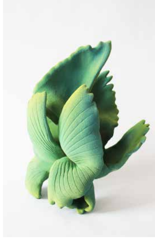
Envol n°2, 2023, Grés chamotté émaillé, Ailes de bécasse, H36 x 26 x 18 cm ©Claire Lindner